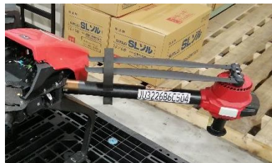
登録記号を表示した P30

なお、6月20日からリモート ID の搭載が義務付けられることから、間際の申請は大変込み合うことが予想されます。新規にドローン導入を計画されている方はお早めにされるとよろしいかと思います。